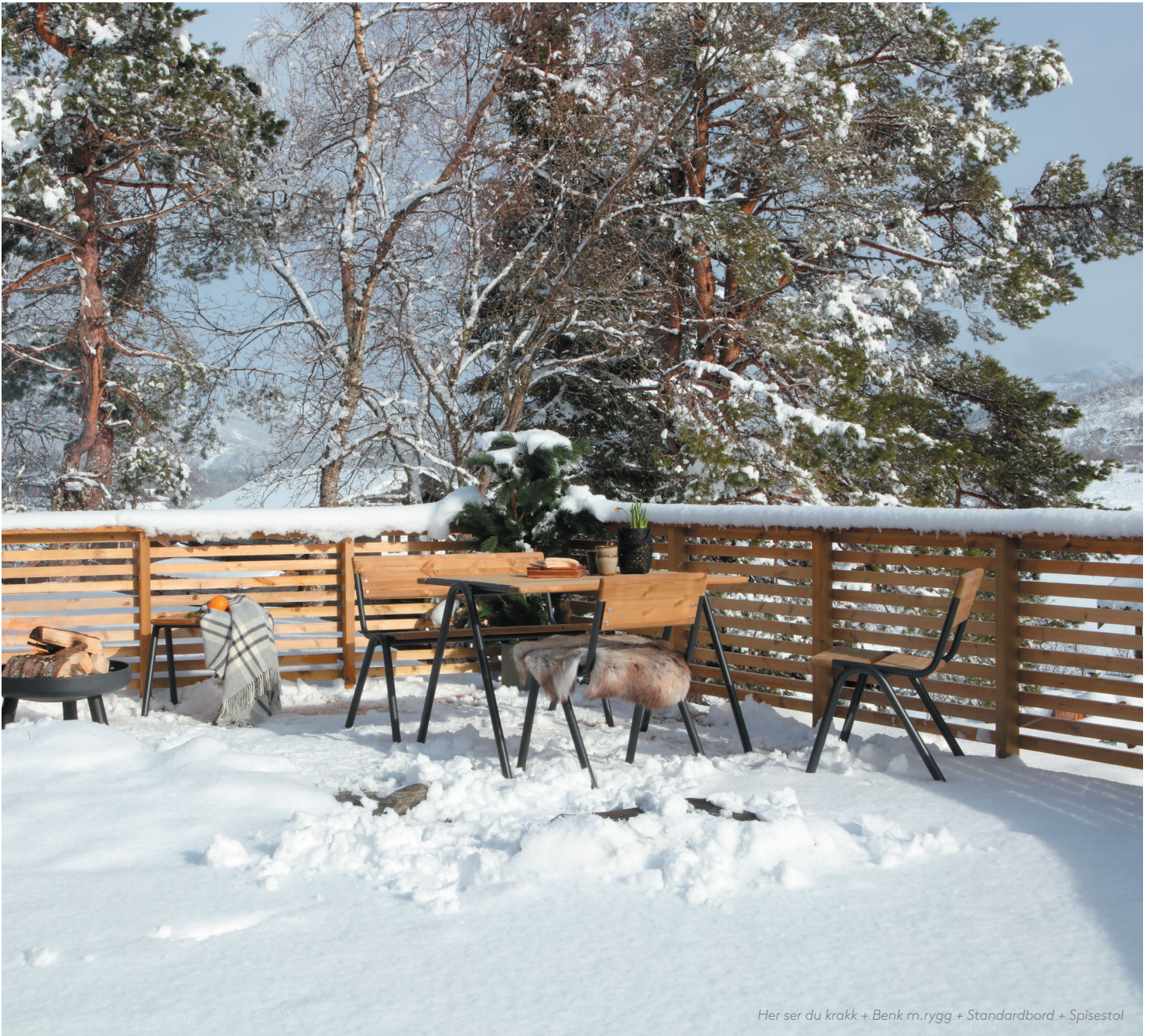
Her ser du krakk + Benk m.rygg + Standardbord + Spisestol